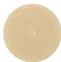
Filtek® Supreme XTE